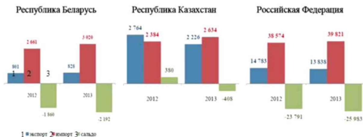
Рисунок - 2. Динамика внешней торговли сельскохозяйственными товарами и продовольствием в странах Таможенного союза в 2013 г. (млн дол. США) [7]

2012 году, объемы экспорта снизились на 7,9% и составили 16,9 млрд. дол. США против 18,3 млрд. дол. США в 2012м году), что свидетельствует о недостаточном уровне конкурентоспособности продукции стран Таможенного союза на рынках третьих стран. Увеличение объемов импорта наблюдается по всем государствам-членам Таможенного союза: в Беларуси – на 13,5% (3,0 млрд. дол. США), Казахстане – на 10,5% (2,6 млрд. дол. США), Россия – на 3,2% (39,8 млрд. дол. США.) (рис. 2).