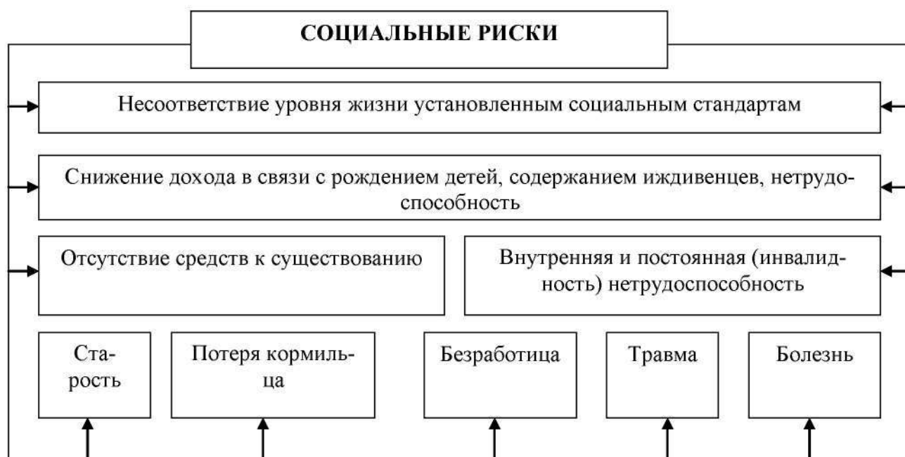
Рисунок 1 – Перечень основных социальных рисков

Создание жизнеспособной системы социальной защиты населения требует научного осмысления экономического содержания этого важнейшего социального института, определения путей дальнейшего его развития, а обзор экономической литературы показывает, что в современных условиях в этом направлении сложилось много подходов, зачастую весьма противоречивых. Так, по определению, приведенному в документах МОТ, «социальная защита» – это набор общественных мер, направленных на устранение различного рода экономических и социальных бедствий. Одновременно нормативный акт детализирует такого рода бедствия.