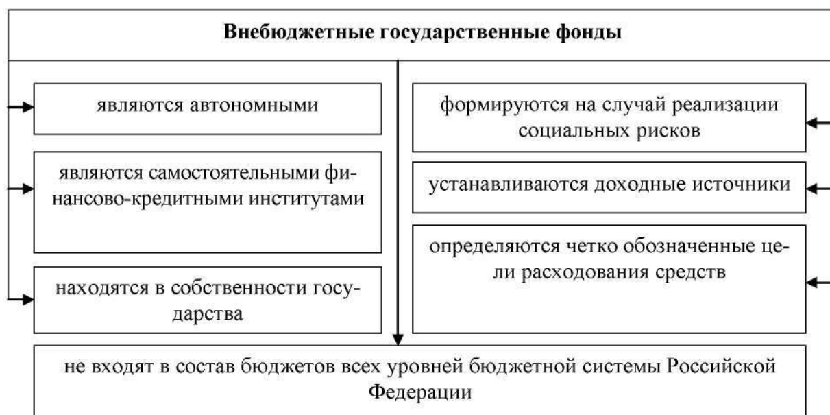
Рисунок 5 – Специфические признаки государственных внебюджетных фондов

назначением, что определяется каждым в отдельности фондом. Специфические признаки государственных внебюджетных фондов отражены на рис. 5.