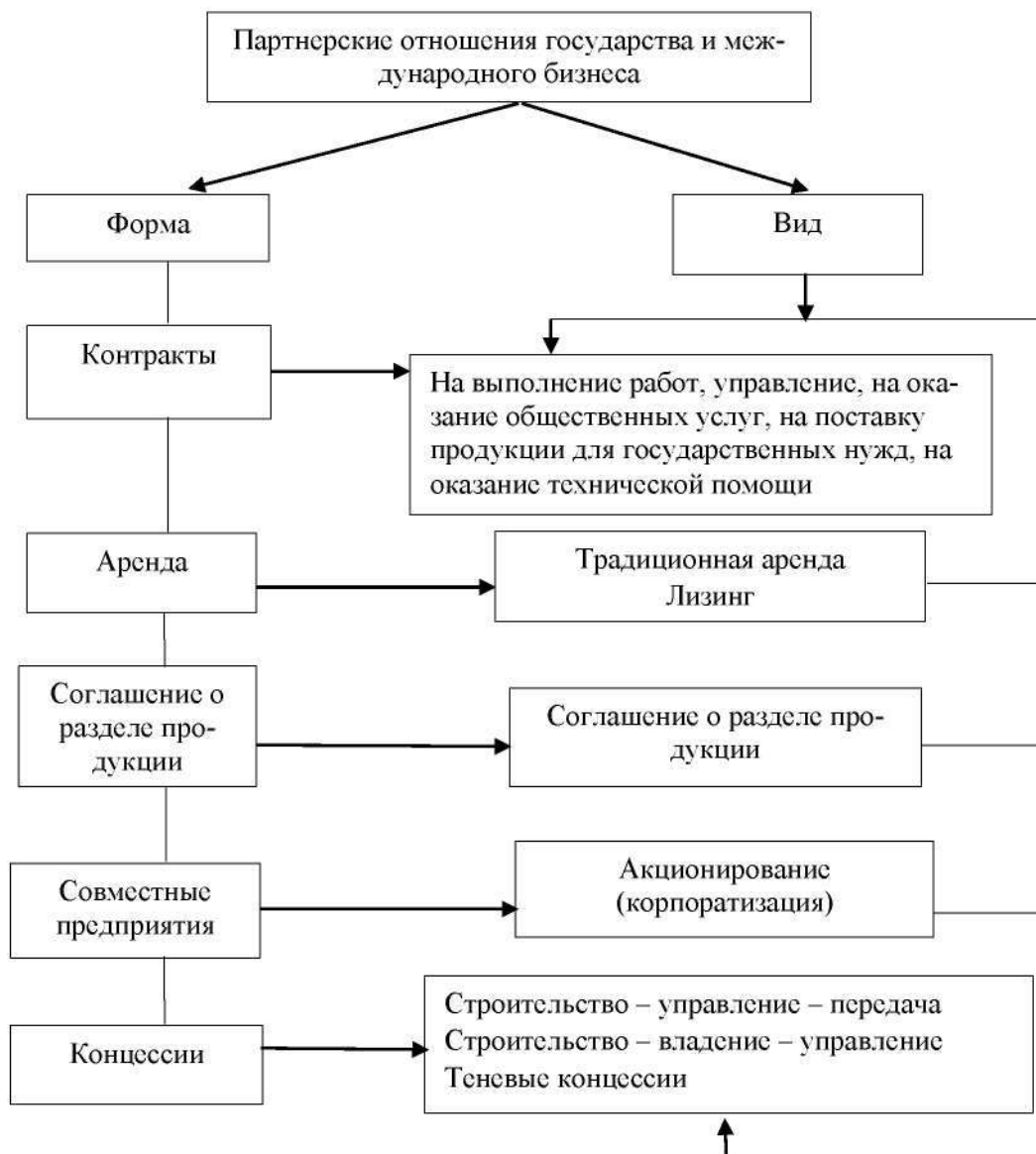
Рисунок 2. - Формы и виды партнерства государства и международного бизнеса [5]

Необходимо подчеркнуть, что все вышеназванные формы взаимодействия частного бизнеса и государства имеют свои преимущества и несовершенства, обуславливающие области их наиболее целесообразного использования в механизме деловых отношений государства и иностранного бизнеса.